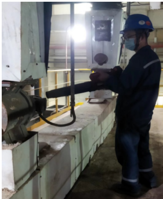
一把葫芦吹散所有浮尘

每当月色婵娟，灯火辉煌， 少坡却为路灯而忙。 一盏盏休息的灯具， 在你熟练的技能下再次发光， 愿和你一起照亮每一个月圆之夜。