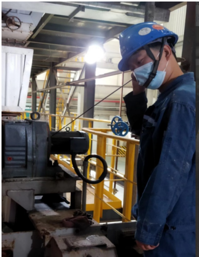
一根听针辨别所有杂音

又到热工保护校验季， 是帅气的宝环和会敏来为它送气加压， 是路通为它送流测量， 一道道标准的程序， 一个个精湛的技术， 才绘出一份份合格的报告。